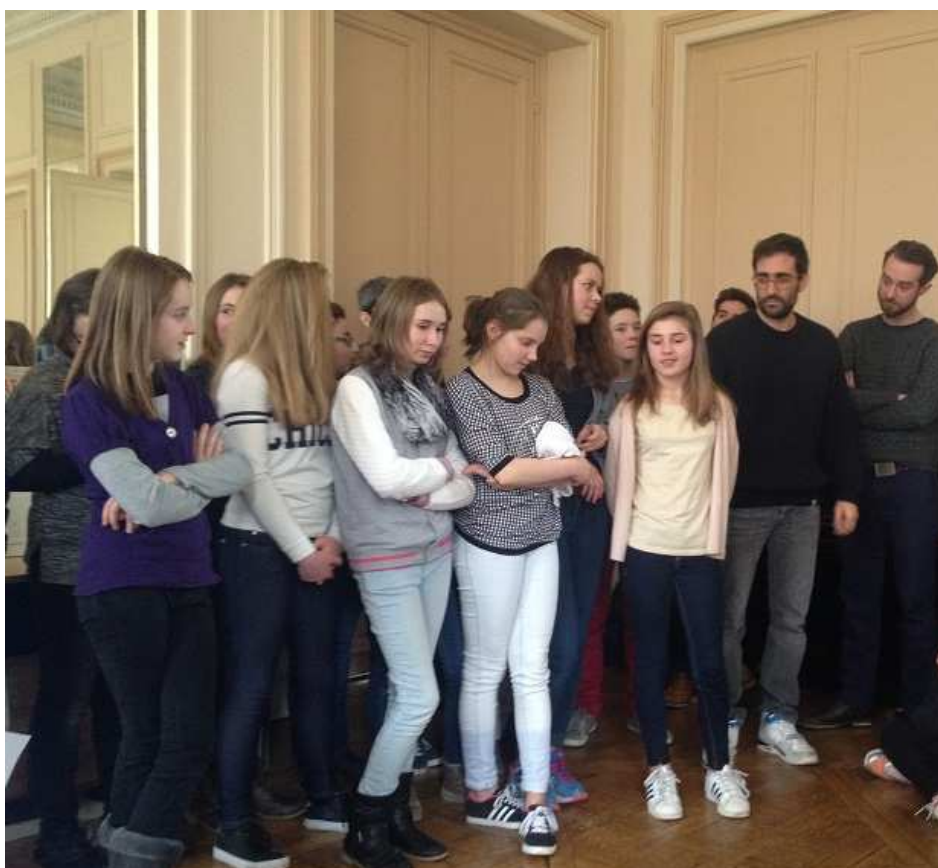
Equipe « Jeter l'encre » - lauréate concours vidéo 15-18 ans - Collège Louis Beuve - La Haye Pesnel (50)